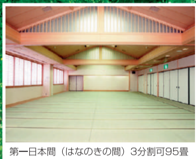
第一日本間 (はなのきの間) 3分割可95畳