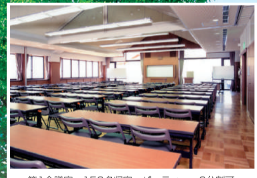
第1会議室 150名収容 パーティー・2分割可