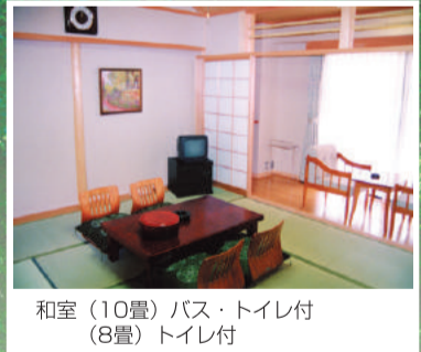
和室 (10畳) バス・トイレ付 (8畳) トイレ付