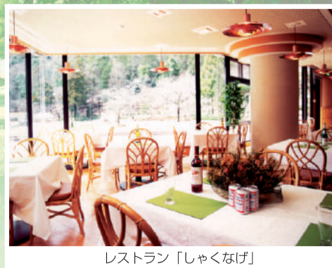
レストラン「しゃくなげ」