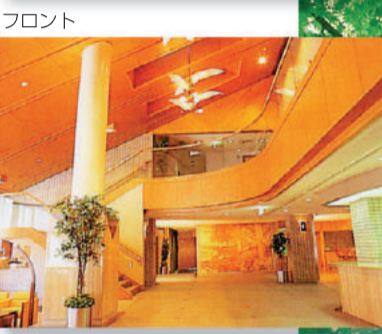
フロント エントランスホール

ご宿泊のご案内 ●チェックイン / 16:00 ●チェックアウト / 10:00 ●ご予約は利用希望の1年前の月の1日からお受けします