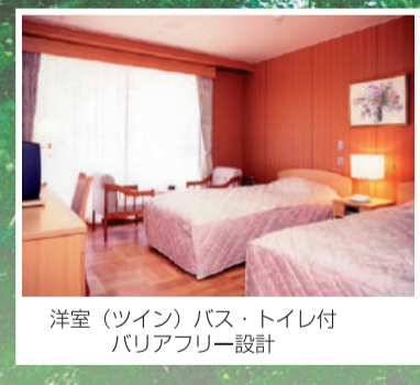
洋室 (ツイン) バス・トイレ付 バリアフリー設計